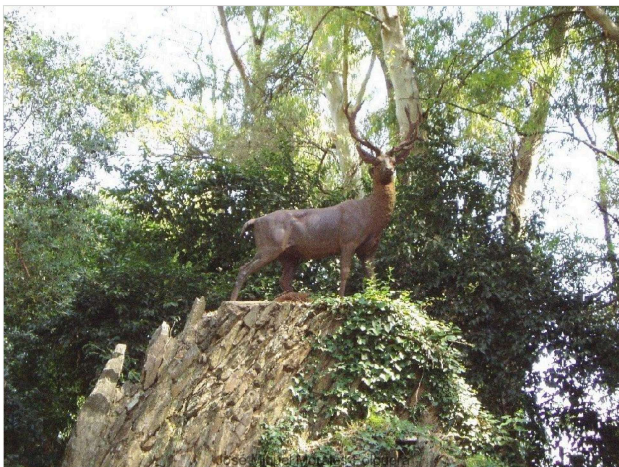
Ciervo, fuente y estanque del ciervo