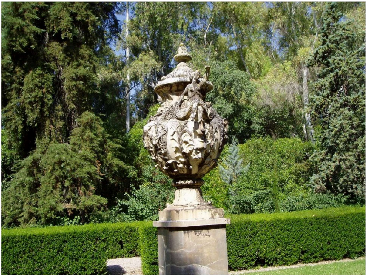
Jarrón con los escudos de los Viana, mascarones, peces y pescadores con redes