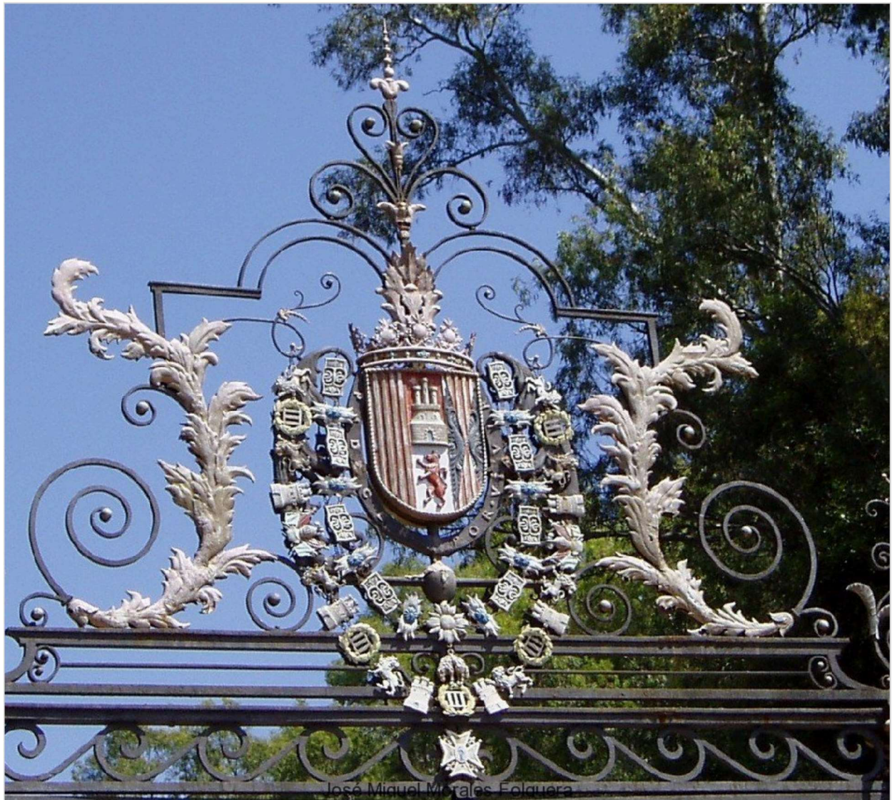
Verja de entrada a los jardines