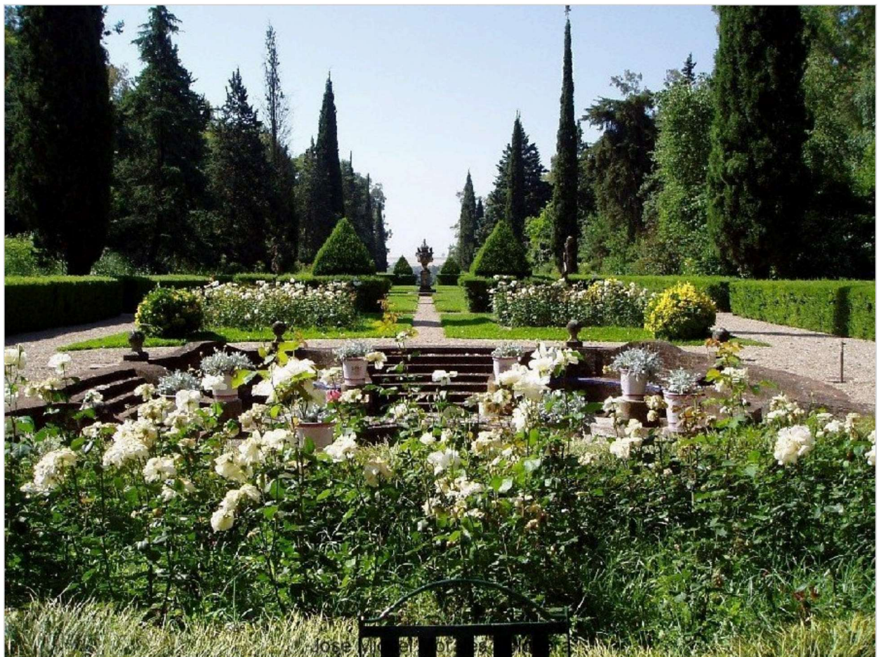
Avenida con fuentes y esculturas mitológicas situada sobre el eje axial del jardín.